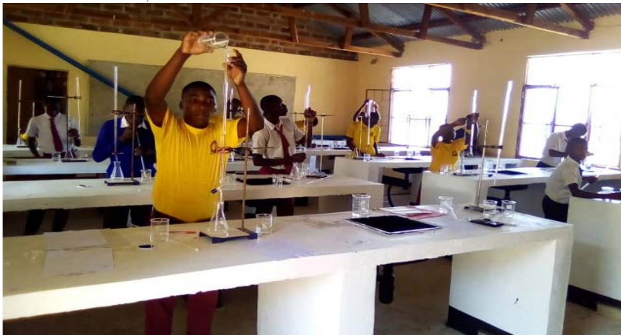
Maabara za Kiriba Sekondari

ELIMU: Jimbo la Musoma Vijijini (Kata 22 zenye Vijiji 68) lina idadi ifuatayo: