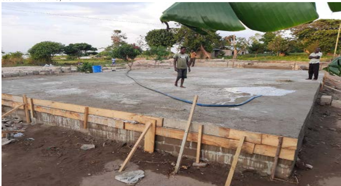
Msingi wa Wodi ya Mama & Mtoto (Fedha za Tozo)

WAKAZI na VIONGOZI wa Kisiwa cha Rukuba, Jimbo la Musoma Vijijini wanaendelea kuishukuru SERIKALI na RAIS wetu, Mhe Dkt. SAMIA SULUHU HASSAN kwa kuwapatia SHILINGI MILIONI 250 za ujenzi wa KITUO cha AFYA cha Kisiwani humo.