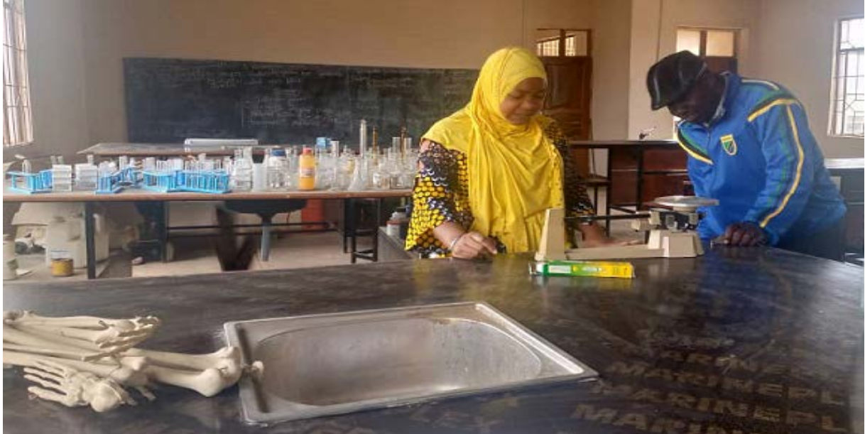
Mkuu wa Shule & Diwani wakiwa ndani ya Maabara ya Biolojia