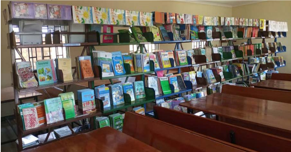
MAKTABA ya Shule ya Msingi Karubugu, Kijijini Kurwaki IMEKAMILIKA