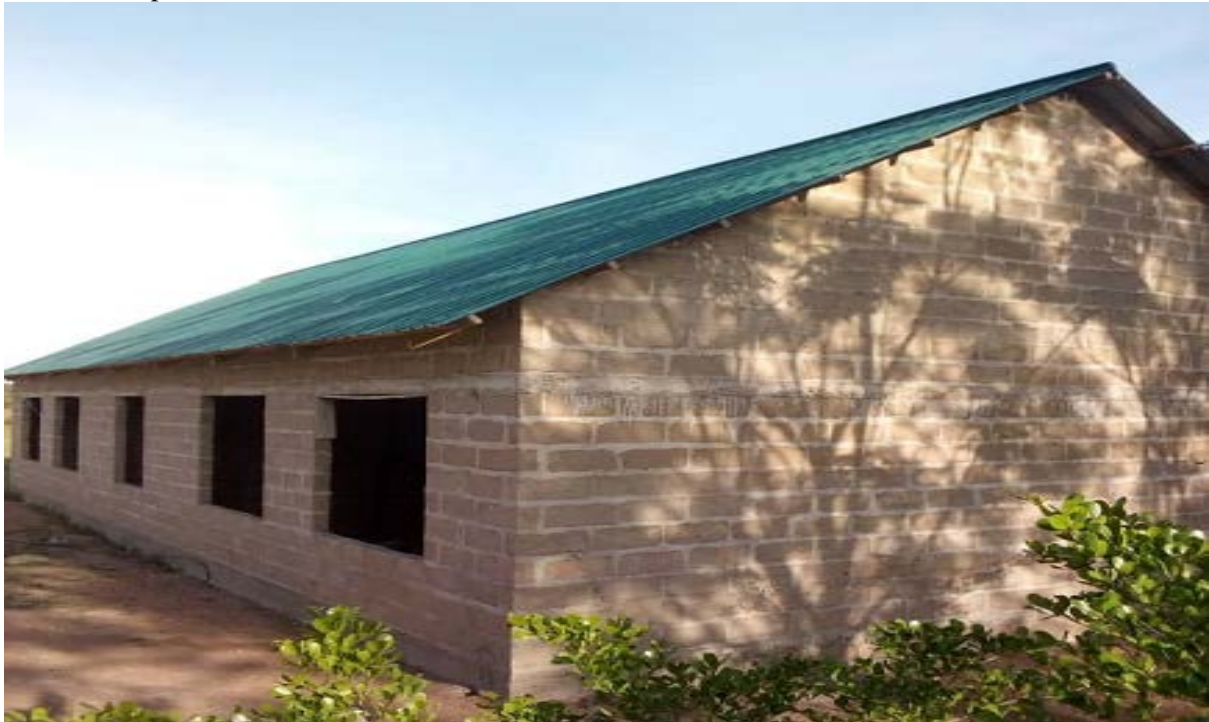
Jengo la Tehama – Agape Primary School

JIMBO la Musoma Vijijini tayari linatekeleza ILANI MPYA ya CCM (2020-2025) kwa SHULE za MSINGI kujenga MAKTABA zao.