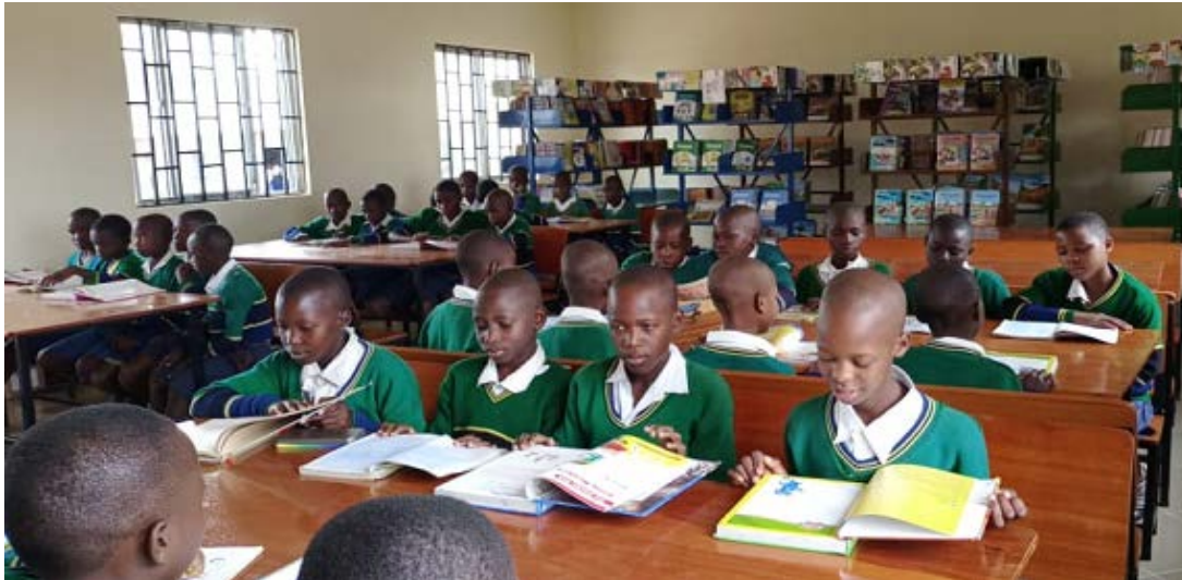
wanafunzi wakiwa ndani ya Maktaba ya S/M Butata