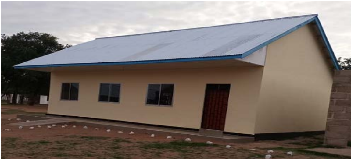
Maktaba ya S/M Butata (Jengo lenye rangi ya krimu)