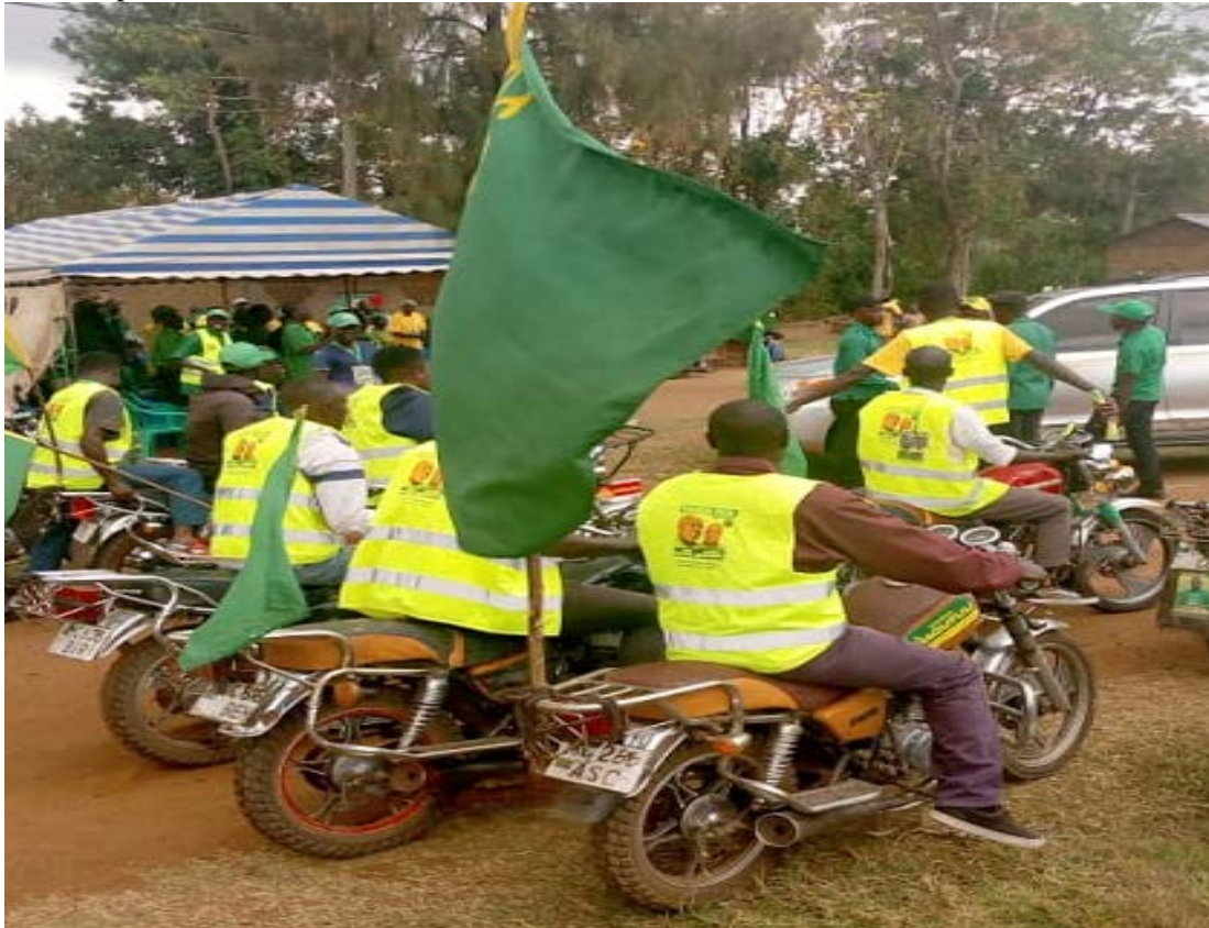
Kampeni za CCM kwenye Kata ya Nyakatende.

Jumanne, 22.9.2020, WANANCHI wa Kata ya NYAKATENDE waliamua wazi wazi kwamba kwenye Kata yao yenye VIJJI VINNE (Kakisheri, Kamuguruki, Kigera na Nyakatende) KURA zote zitaenda CCM.