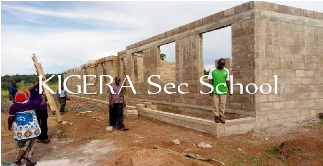
KIGERA Sec School