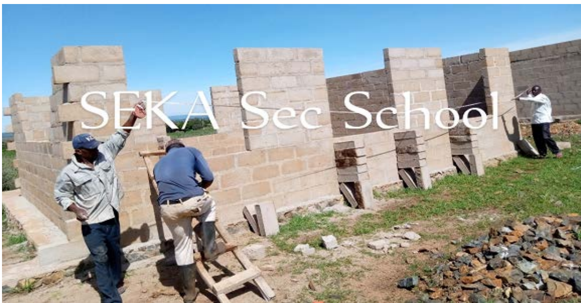
SEKA Sec School