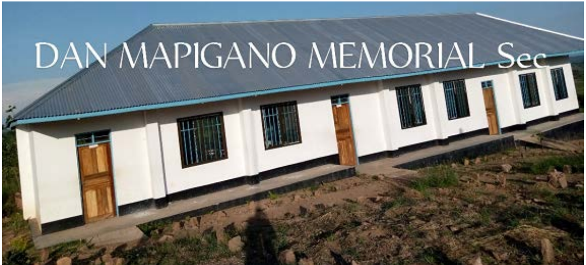
DAN MAPIGANO MEMORIAL Sec