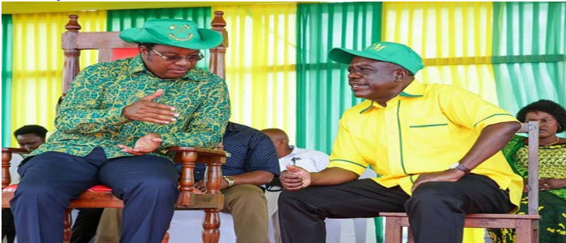
Waziri Mkuu, Mhe Kassim Majaliwa Majaliwa akiteta jambo na Prof Muhongo

Jumatatu, 21.9.2020, Waziri Mkuu, Mhe Kassim Majaliwa MAJALIWA amepiga KAMPENI yenye MAFANIKIO MAKUBWA ndani ya Jimbo la Musoma Vijijini.