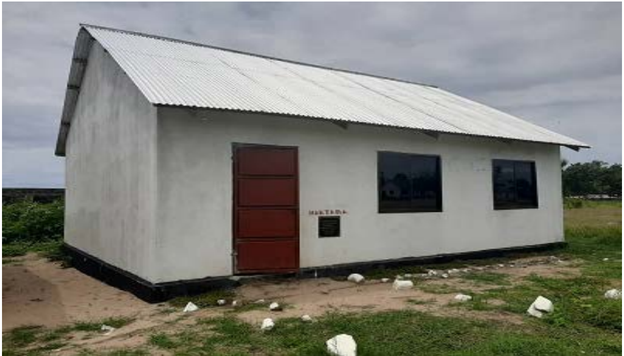
Jengo la Maktaba Shule ya Msingi Rukuba