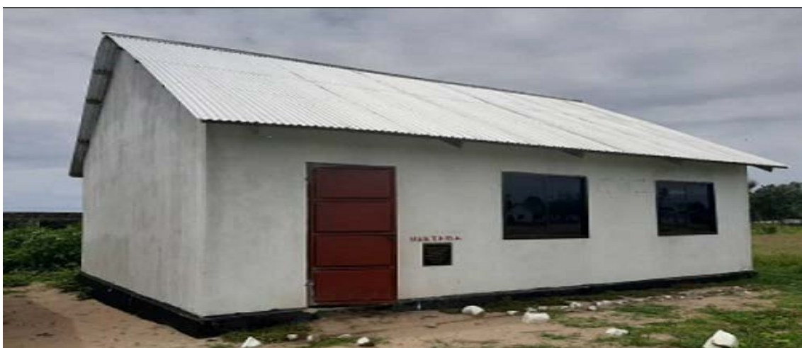
Maktaba ya S/M Rukuba (Jengo lenye rangi nyeupe). Hii Maktaba iko Kisiwani Rukuba