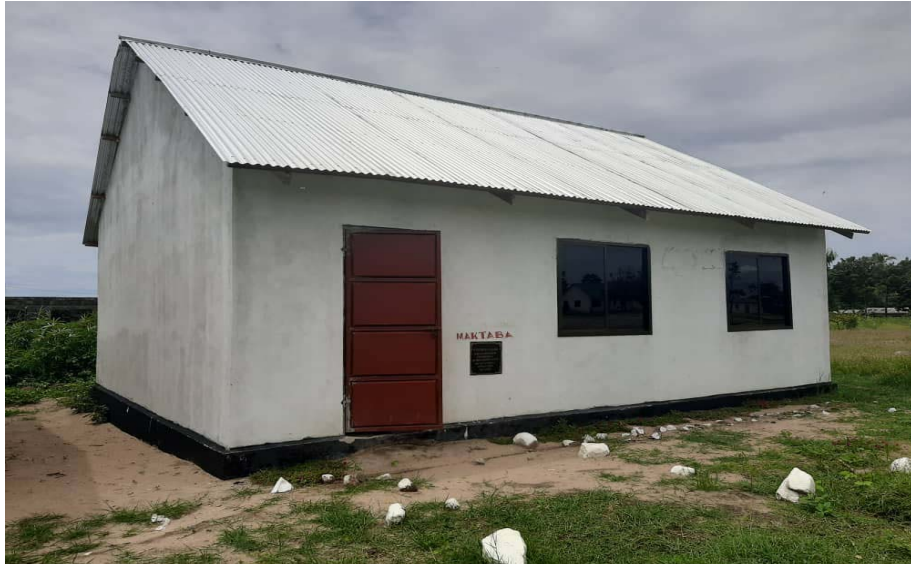
Makataba ya Shule ya Msingi Rukuba iliyopo Kijijini Rukuba (Kisiwani) iliyojengwa kwa MICHANGO ya Wananchi, PCI, Mbunge wa Jimbo na Wadau wengine wa Maendeleo