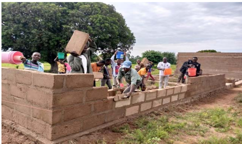
Wananchi wa Kijiji cha Buanga wakijumuika pamoja na Viongozi wao wa Kata na Kijiji katika ujenzi wa Shule Shikizi ya Buanga