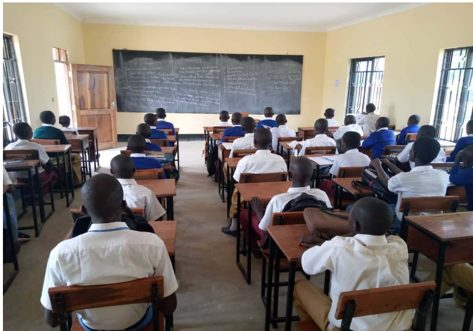
Wanafunzi waliojiunga na Kidato cha kwanza katika Shule Mpya ya Sekondari ya Kata ya Busambara