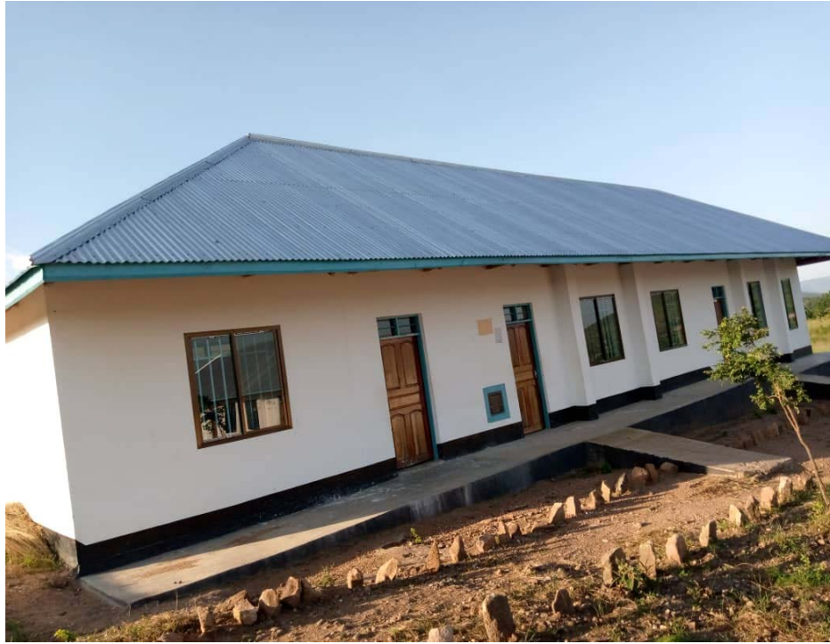
Moja ya majengo ya Vyumba vya Madarasa ya Dan Mapigano Memorial Secondary School iliyojengwa katika Kata ya Bugoji