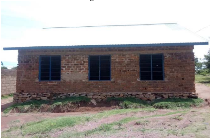
Maktaba ya Shule ya Msingi Buraga iliyopo Kijijini Buraga ambayo inajengwa kwa MICHANGO ya Wananchi