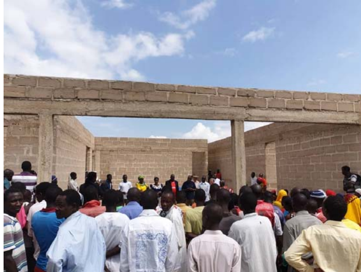
Wananchi wa Kijiji cha Kurwaki pamoja na Mbunge wa Jimbo, Profesa Sospeter Mwijarubi Muhongo wakiwa kwenye Harambee ya uezekaji wa Zahanati ya Kurwaki