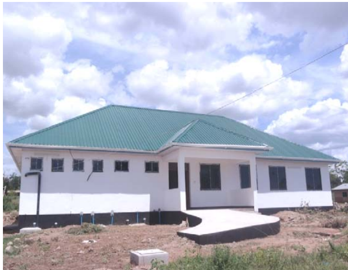
Moja ya Majengo ya Kituo cha Afya cha Kata ya Mugango

Mbunge wa Jimbo Prof Sospeter Mwijarubi Muhongo amechangia Jumla ya Mifuko 400 ya Saruji kwa ajili ya ujenzi wa upanuzi wa Zahanati ya Mugango kuwa Kituo cha Afya. Serikali ilichangia Shilingi Milioni 400 kwa ajili ya ujenzi huu. NGUVUKAZI za Wananchi wa Kata ya Mugango zimetoa mchango mkubwa sana kuharakisha na kukamilisha ujenzi huu.