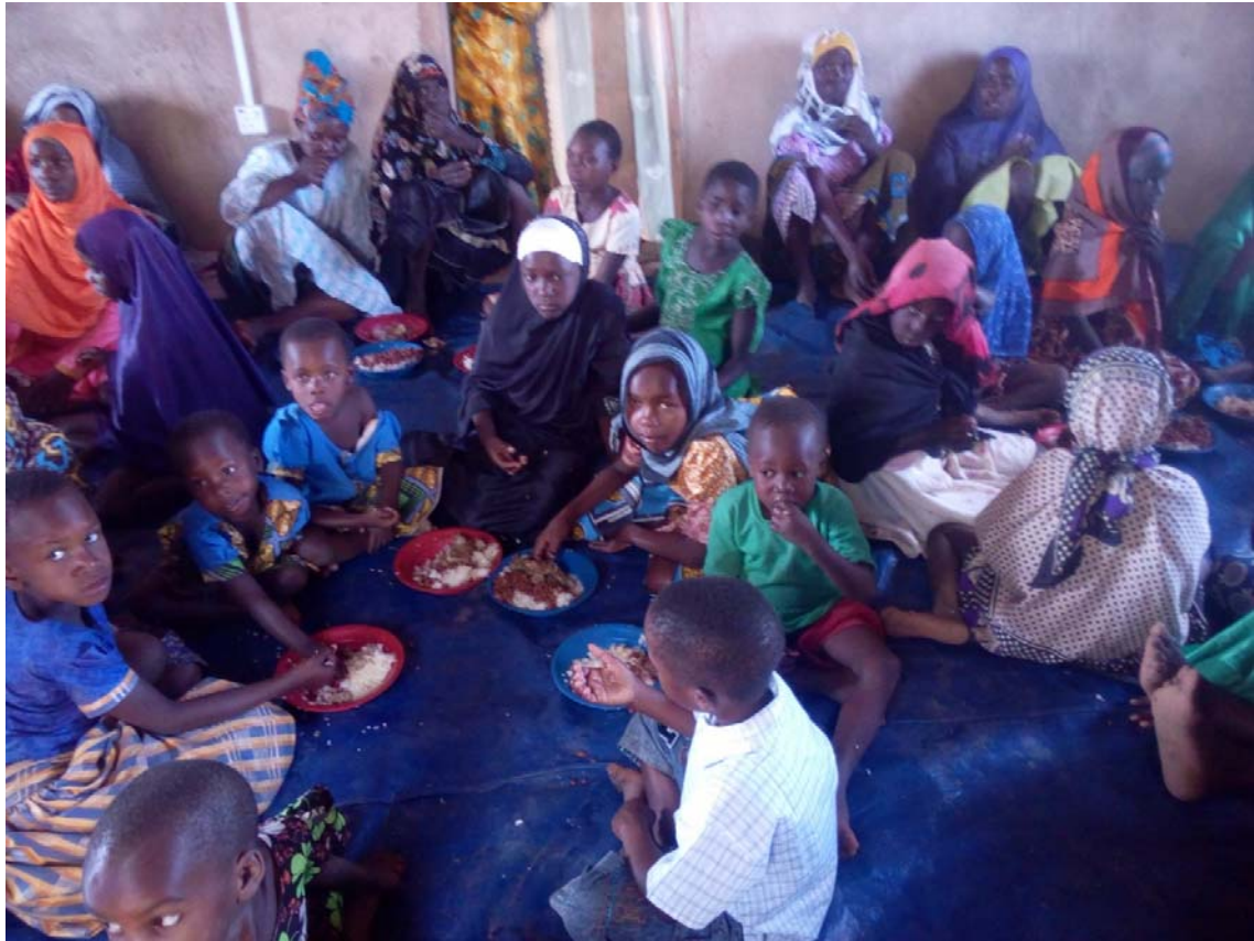
Waumini wa Dini ya Kiislam wakishiriki futari ya pamoja katika Msikiti wa Busekela wakati wa Mfungo wa Mwezi Mtukufu wa Ramadhan

Katika Sikukuu zote hizo Mbunge wa Jimbo la Musoma Vijijini amekuwa akichangia michango mbalimbali ambayo ni pamoja na: