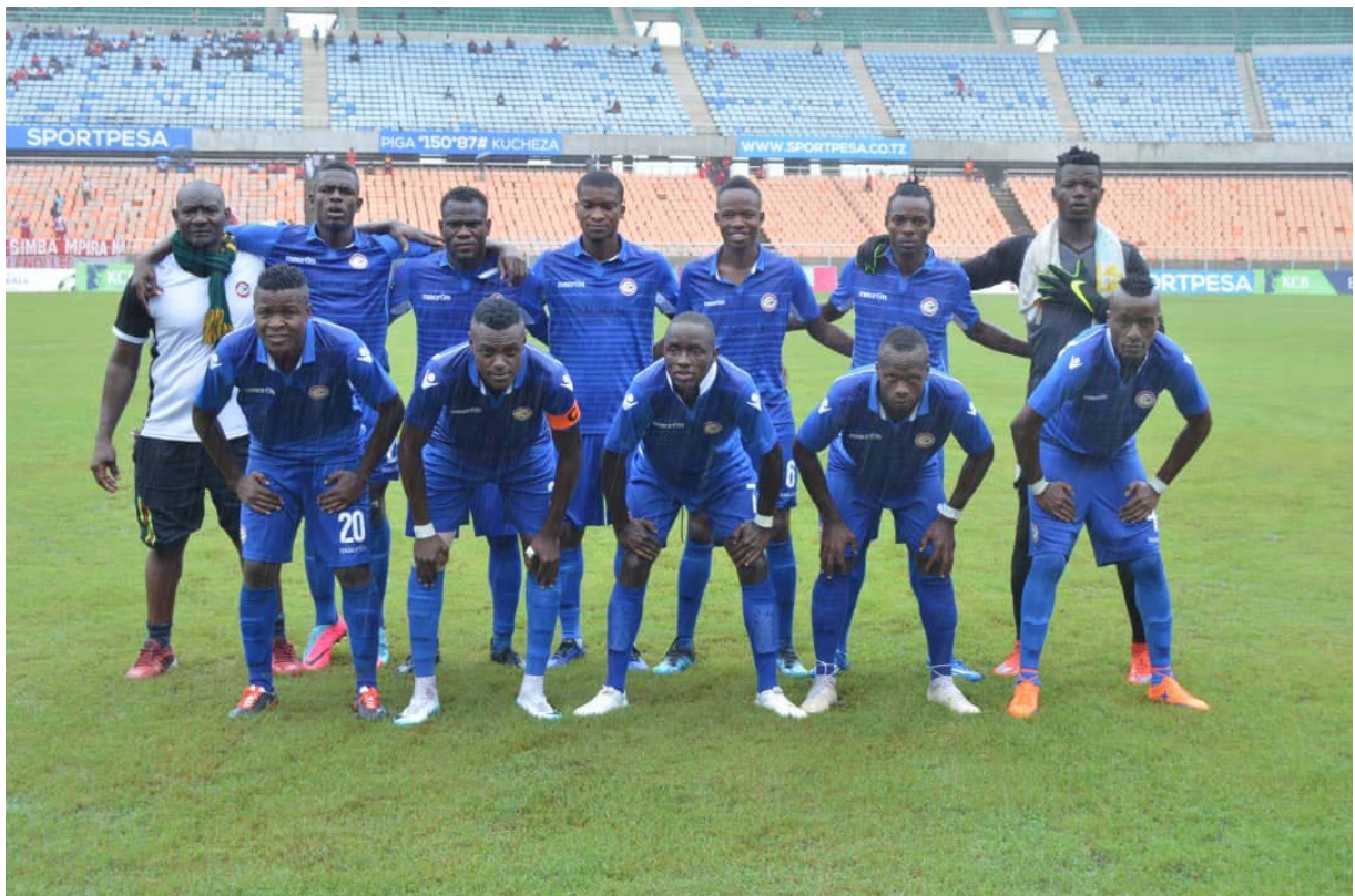
Wachezaji wa Timu ya Mpira wa Miguu ya Biashara United Mara ambayo inashiriki Ligi kuu ya Tanzania Bara (TPL), 2018/2019

Kwa upande mwingine, Mbunge wa Jimbo amewahi kutoa mipira na jezi kwa timu zote za Vijana katika Vijiji vyote 68 na mashuleni. Mbali na Timu hiyo ya Biashara, Mbunge wa Jimbo la Musoma Vijijini anatarajia kuunda Timu ya Jimbo la Musoma Vijijini kupitia Mashindano ya vijana Vijijini, Katani hadi Jimbo kwa kuchagua vipaji na hatimaye kuwa na hazina kubwa ya vijana watakaoweza kuchukuliwa na Timu ya Biashara United na timu nyingine kubwa za ndani na nje ya nchi.