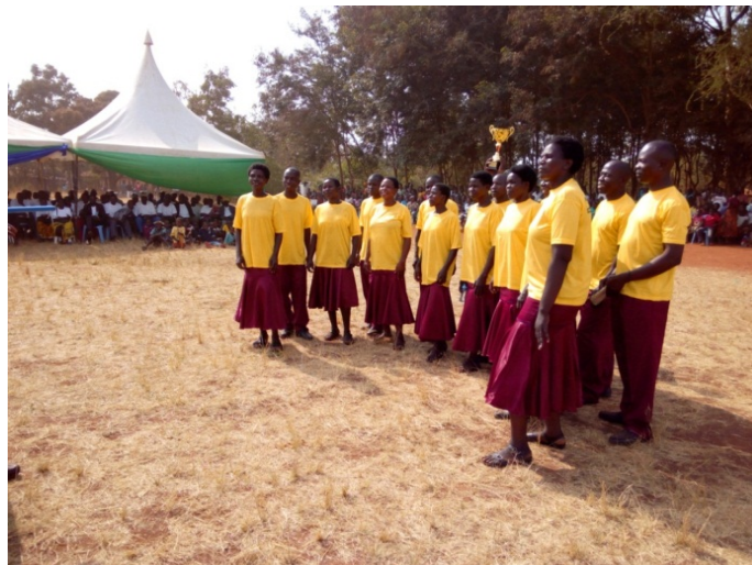
Kikundi cha Kwaya kutoka Kata ya Bugoji kilishika nafasi ya kwanza katika Mashindano ya Nanenane yaliyofanyika Agost 8, 2016 katika Kijiji cha Suguti, Kata ya Suguti