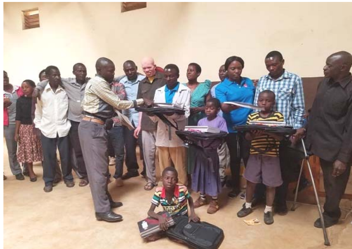
Makabidhiano ya Vifaa vya Elimu kutoka BMZ kwenye Kata ya Nyamrandirira

macho, baiskeli za watu wenye ulemavu, miwani, miguu bandia na vifaa vingine wezeshi vikiwemo vifaa vya kusaidia usikivu mzuri. BMZ wanahusika pia na uundaji wa Vikundi vya watu wenye ulemavu kwa ajili ya kuwafadhili katika Miradi ya uzalishajii. Miongoni mwa Vikundi hivyo ni: ERUSULI SHIVYAWATA GROUP (Kata ya Kiriba), JIBIDISHE (Suguti), USHIRIKA (Bukumi), MTAZAMO (Murangi) na UPENDO (Bugwema) Mbunge wa Jimbo la Musoma Vijijini anaendelea kushirikiana na BMZ kuhakikisha Mradi huu unaendelea kuwasaidia na kuwawezesha ki-uchumi watu wenye ulemavu na kuwaomba Wadau wengine waendeleo kuwasaidia na kuwawezesha watu wenye ulemavu Jimboni.