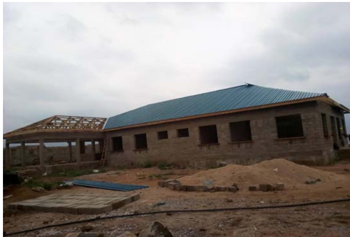
Moja ya Majengo ya Hospital ya Wilaya inayojengwa katika Kitongoji cha Kwikonero, Kijijini Suguti, Kata ya Suguti

Uongozi wa Rais Dkt John Joseph Pombe Magufuli kwa kutoa Shilingi bilioni 1.5 kwa ajili ya ujenzi wa Hospitali ya Wilaya inayojengwa kwenye Kitongoji cha Kwikonero, katika Kijiji cha Suguti, Kata ya Suguti. Wananchi kupitia Viongozi wa Kata na Vijiji wamekubaliana kuchangia Shilingi Milioni 2 kila Kijiji na Mbunge wa Jimbo yuko tayari kuchangia ujenzi huu muda ukiwadia.