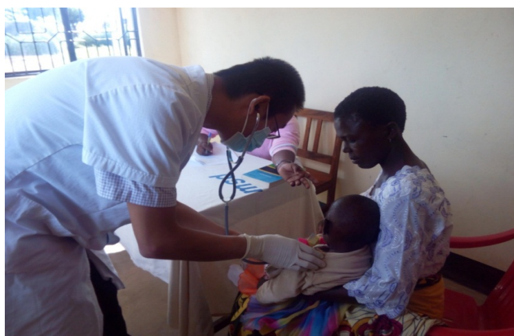
Daktari Bingwa kutoka nchini China akimchunguza mtoto mgonjwa kwenye Zahanati ya Kijiji cha Kwikuba