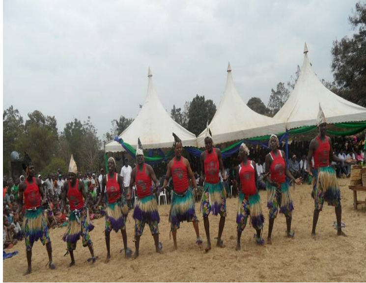
Kikundi cha KIWAJAKI kutoka Kata ya Kiriba kikishiriki katika Mashindano ya Sherehe za Nanenane Kijijini Suguti. Ilikuwa tarehe 8/8/2016